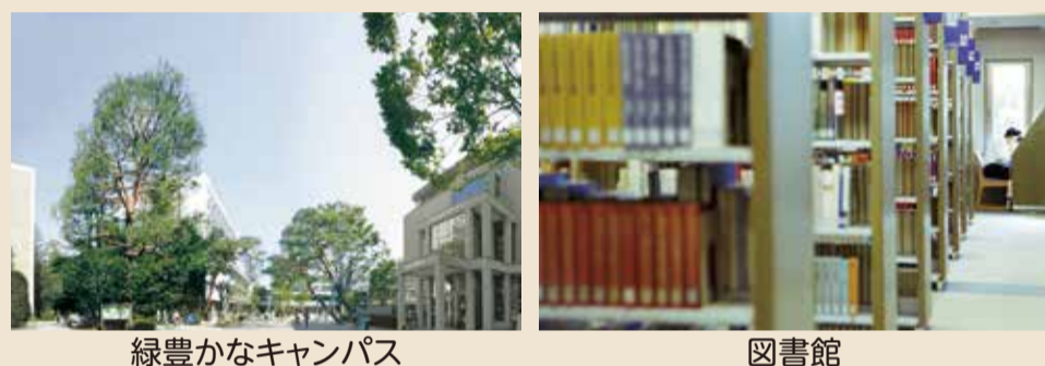
緑豊かなキャンパス

成城大学が2006年から始めた、生涯学習支援事業です。参加する皆さまに学ぶ楽しさを味わっていただくこと。また、講師と受講生、受講生同士の交流の輪を広げること。この二つを通して、皆さまと共に「学びの森」という豊かで居心地の良い拠点を成城大学につくりあげたい、という願いが込められています。その一環であるコミュニティ・カレッジは、少人数を対象に、成城大学の教員が中心となって講師を務めています。受講生はリピーターが多く、アットホームな雰囲気が評判です。